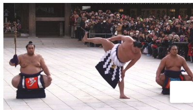
( http://video.tagesspiegel.de/4689515862017?lightbox=1&sidebar=main )

» alle Videos ( http://video.tagesspiegel.de )